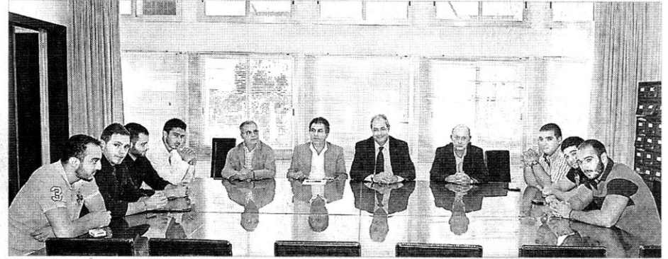
خلال الاجتماع: ممثلو ادارة الجامعة في الوسط وممثلو 14 آذار من اليمين و8 آذار من اليسار. (ميشال صايغ)

وفي ضوء هذا الموقف من إدارة الجامعة، توافق مسؤولو الطلاب الحزبيين في حرم العلوم الاجتماعية على التوقيع على