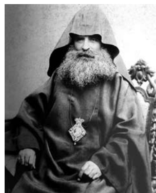
Le catholicos Sahak II, 1902-1939. Le siège de la Maison de Cilicie est aujourd'hui à Antélias.

Dans ces conditions, ces photos se transforment en des images emblématiques, en des symboles d'un temps révolu à jamais. Portraits familiaux et individuels, des ateliers et leurs artisans, des marchés et leurs clients, des écoles et leurs élèves, des églises et leurs fidèles peuplent les pages de