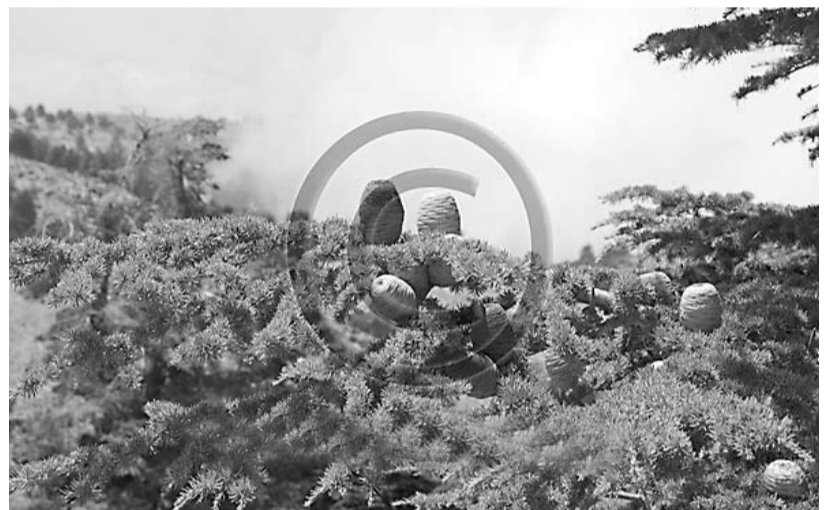
Le fameux Cedrus libani .