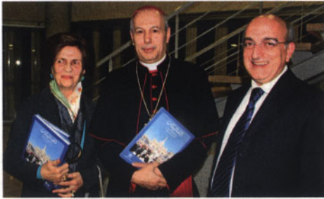
السفير غبريال كاتشيا ومشاركون في الندوة