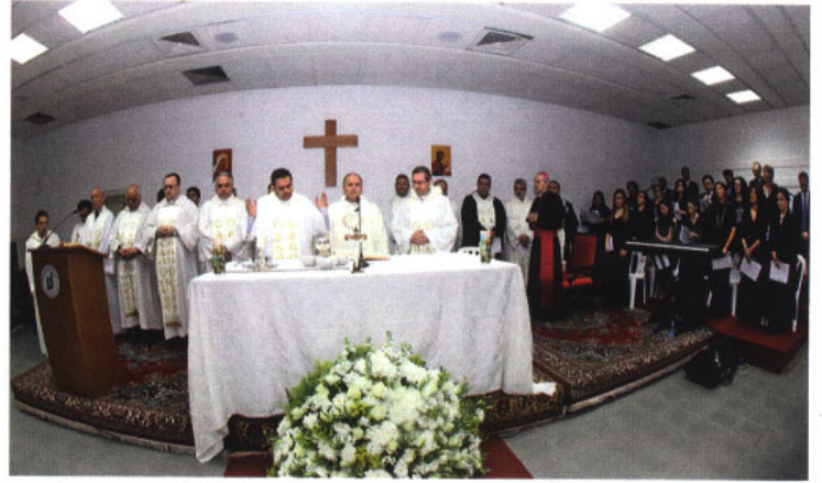
البروفسور دكاش وكهنة أمام المذبح