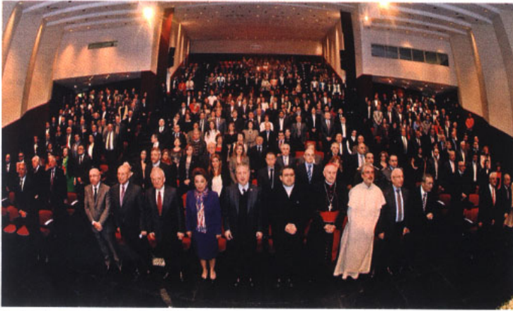
الحضور في حرم الجامعة

استبدل السفير البابوي غابريال كاتشيا صورة قداسة البابا التي كان يحملها سنويًا هدية لمعايدة إدارة الجامعة اليسوعية في عيد شفيعتها القديس يوسف، بأخرى هي كناية عن قطعة أرض في الأشرافية لبناء بيت للطالبات والسيدات وتتضمن كنيسة على اسم القديس يوسف. وأعلن كاتشيا عن الهدية في الكلمة التي ألقاها خلال القداس السنوي الذي أقامته الجامعة لمناسبة عيد شفيعتها في حرم العلوم والتكنولوجيا. مار روكز ترأسه رئيس الجامعة البروفسور سليم دكاش اليسوعي وعاونته لفييف من الآباء وحضره حشد سياسي وديني وتربوي وعمداء الكليات والمسؤولين الإداريين. وأوضح كاتشيا أن الهدية هي التزام بالدخول في مرحلة العمل الاجتماعي ومساعدة الأشخاص ذوي الإمكانات الضعيفة. وركز البروفسور دكاش في كلمته على ضرورة الإصغاء الى الطلاب وهم يعبرون عن تطلعاتهم وأمنياتهم، واعتبر أن انتهاك أي من مؤسسات الدولة هو اعتداء على الدولة، داعيًا الجميع لتأسيسها والمشاركة في انتخاب رئيس للجمهورية. وأعلن أن السنة المقبلة هي سنة الـ100000 خريج من جامعة القديس يوسف.