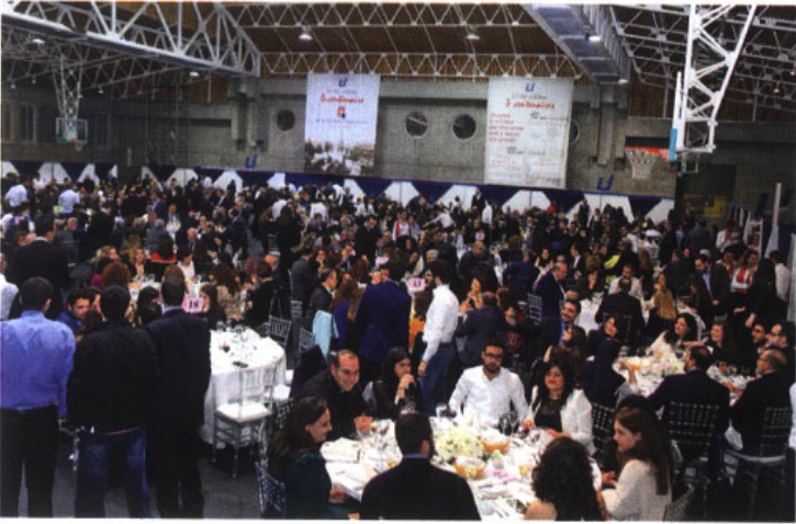
مشاركون في عشاء العيد