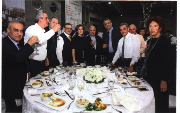
نخب العيد والأرض