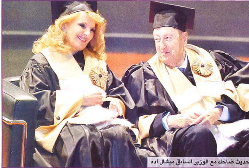
حديث ضاحك مع الوزير السابق ميشال اده