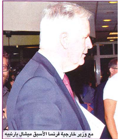
مع وزير خارجية فرنسا الأسبق ميشال بارنييه