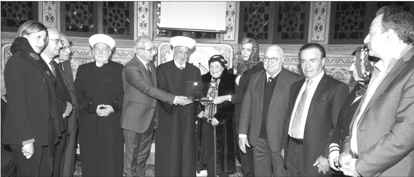
التكريم الأخير بغيابه وحضور عائلته في دار الفتوى

غيب الموت أمس النائب السابق الدكتور عمر مسيكة بعد صراع مرير مع المرض. وبرحيل الدكتور مسيكة يفقد لبنان الرسمي والإداري والثقافي والسياسي علماً كبيراً من رجالات الدولة اللبنانية الذي ترك بصمات مضيئة في تاريخ لبنان في أحلك ظروف الحرب التي عصفت بالبلاد.