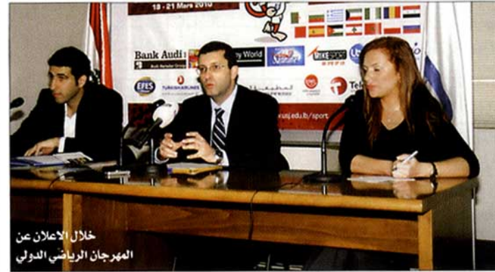
خلال الاعلان عن المهرجان الرياضي الدولي

دعت الجامعة للمشاركة في البطولة العالمية للجامعات التي ينظمها الاتحاد العالمي للرياضات الجامعية وأحرزت المركز الثالث في كرة السلة للنساء، كما دعت للمشاركة في عدد كبير من المباريات العربية والدولية، وسيشارك في المهرجان بعثات من الجزائر والبحرين وسوريا وبلغاريا واسبانيا واليونان والاردن والمغرب ونيجيريا وبولونيا ورومانيا وروسيا والكويت والبلد المضيف لبنان. وستقام المنافسات في المركز الرياضي التابع لمدرسة الجمهور ومجمع ميشال المر الرياضي وملاعب الحرم الجامعي في كلية العلوم الإنسانية في بيروت ■