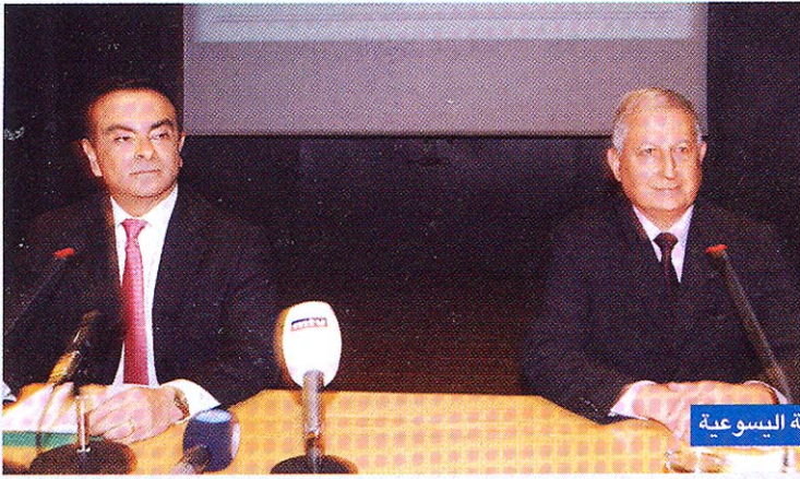
غصن في الجامعة اليسوعية