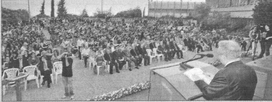
جانب من الحضور في حفل التخرج ويبدو الأب شاموسي يلقي كلمته