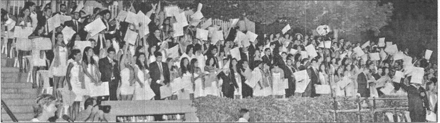
الطلاب يرفعون شهاداتهم

متواصلًا ويكون في خدمة زملائه والمبتدئين في هذه المهنة ويتقاسم معهم النجاح. وختم: هذه هي الأبعاد الأربعة التي رغبت في أن ألقت انتباهكم إليها. فيجب في هذا اليوم الاحتفالي التذكير بهذه المتطلبات المهمة التي يترقب عليكم احترامها إن أردتم تحقيق النجاح.