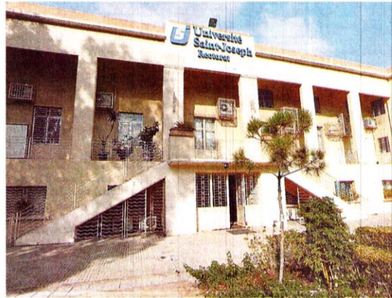
مبنى رئاسة جامعة القديس يوسف على طريق الشام. (ميشال صايغ)

ويعزو حكيم تطور العلاقات الخارجية للجامعة الى المشاريع الأوروبية التي تتطلب اتصالات عدة، كما ان الجامعة اليسوعية تبنت اصلاح بولونيا عام 2003 واتبعت نظام LMD الذي يشمل تبادل الطلاب والاساتذة، مما منح زخماً لهذه العلاقات. ورغم ان القسم "حديث نوعاً ما"، الا ان ذلك لم يمنع الجامعة من توسيع شبكة علاقاتها الدولية وانتقلت من فرنسا الى أوروبا وأميركا وصولاً الى العالم العربي الذي يشكل بلاد الجوار والمجال الأسهل للعلاقات، إذ سمعة الجامعة فيه من الأفضل لأنها من الاعرق، مما يفسح لنا مجالاً واسعاً رغم التباين الموجود بين لغتنا الفرنسية واللغة الانكليزية المسيطرة في المنطقة العربية، لكننا تجاوزنا الأمر لأن اساتذتنا قادرين على التدريس باللغات الثلاث. وفي حين افتتحت الجامعة فرعاً لكلية الحقوق في دبي، يشير حكيم الى ان علاقة الجامعة بالطلاب العرب تعود الى